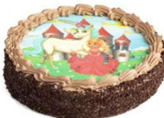
Variante mit Prinzessin