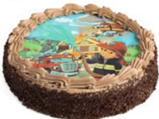
Variante mit Feuerwehrmann